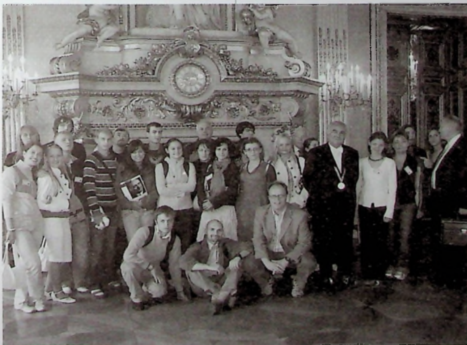
A szeminárium résztvevői a francia külügyminisztériumban