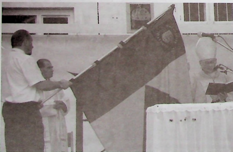
A Kolping zászlószentelés pillanatai