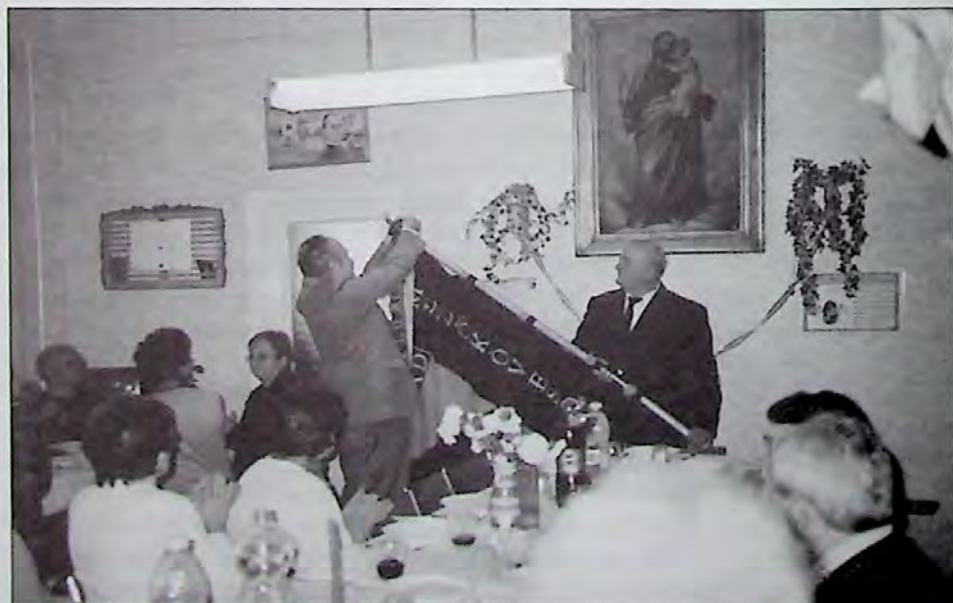
Tizenöt éves a mezőkövesdi Kolping család