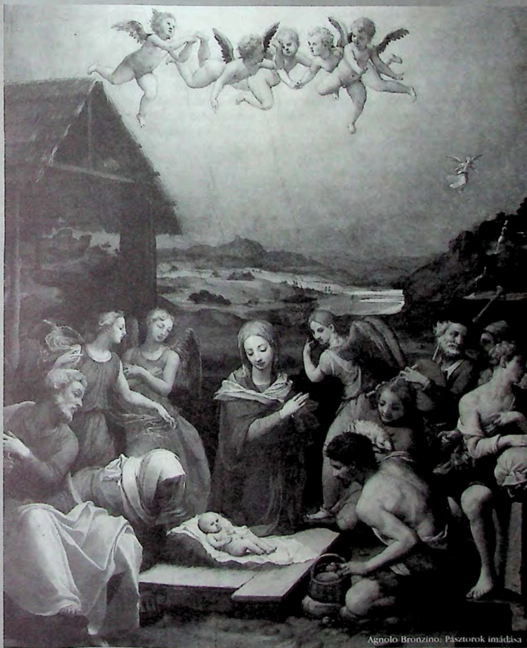
Agnolo Bronzino: Pásztorok imádása

Aldott karácsonyi ünnepeket és békés, boldog új esztendőt kíván a Magyar Kolping Szövetség vezetősége!