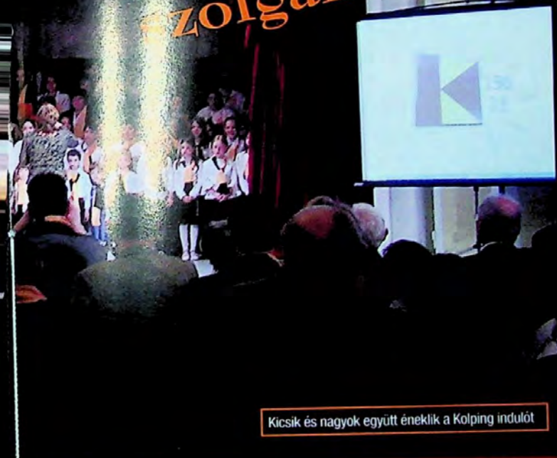
Kicsik és nagyok együtt éneklék a Kolping indulót