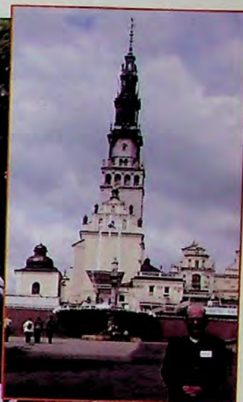
A cheshchuhovai záradok templom

Május 29-án a varsói Pilsudski téren bemutatott ünnepi szentmisén XVI. Benedek pápa párhuzamba állította a két nagy főpap, Wyszynski bíboros és II. János Pál alakját. Nemesak ugyanaz a hit, remény és szeretet fűzte őket egybe, hanem ugyanazok a történelmi események kapesolták egybe őket hazájuk történelmével. A hit ajándék és ugyanakkor feladat is: mint az Istenre és emberre vonatkozó igazság megvallása – mondotta a pápa. – Ma is sokan vannak, akik félretéve az évszázados hagyományt, meg akarják hamisítani Krisztus igejét, és az evangéliumot meg akarják fosztani az