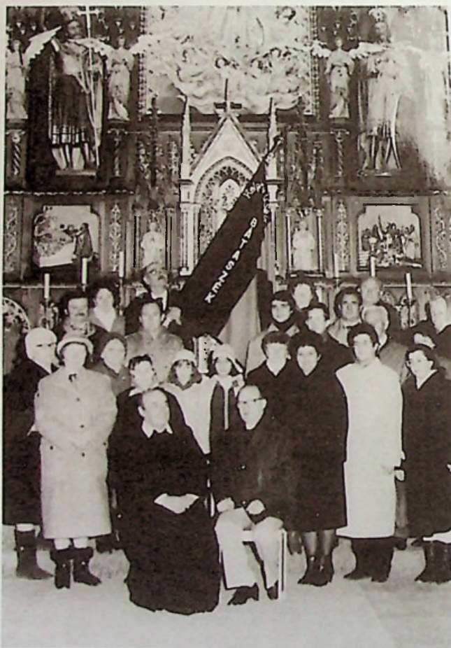
A Bátaszéki Kolping Család alapító tagjai

bejegyzett és egyházilag jóváhagyott szervezet – létrejött a Magyar Kolping Szövetség szabályai szerint, annak tagjaként, a Magyar Püspöki Kar elnökének védnökségével. Ezen a nagyon szép eseményen többen is részt vettünk az alapító tagok közül. Ugyancsak többen ott voltunk Rómában is 1990. november