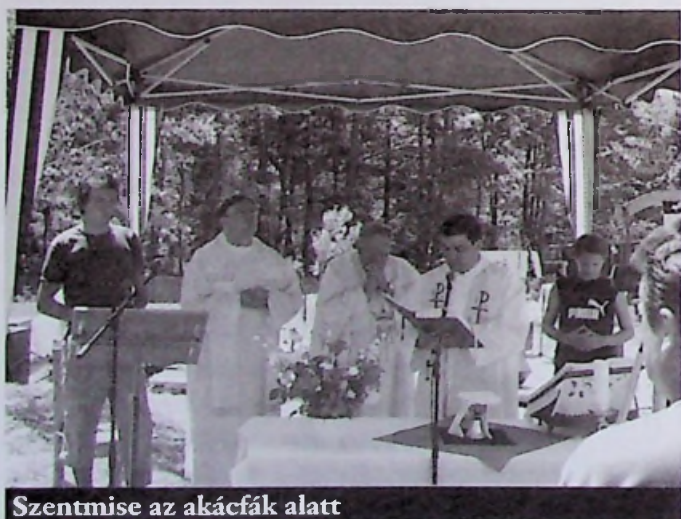
Szentmise az akácfa alatt

Mindez nem volt elég a békediktátum kitervelőinek. A megcsonkított és magalázott, a román megszálló csapatok által kirabolt Magyarországot hatalmas jóvátétel megfizetésére kötelezték.