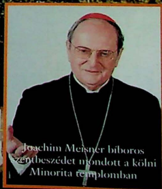
Joachim Meisner bíboros szentbeszédet mondott a kölni Minorita templomban