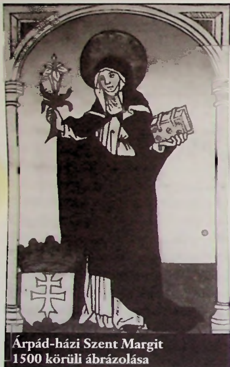
Árpád-házi Szent Margit 1500 körüli ábrázolása

- Nem a látványos dolgokat tartom igazi eredménynek. Nem szoktam visszatekinteni, mindig az újabb feladatok foglalkoztatnak. A templom-, plébániaépítés csak külső feltételei voltak az igazi munkának, a lelki vezetésnek. A jól végzett munka