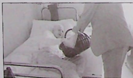
Szívünkben a szeretet, hitünkben a feltámadás