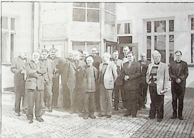
Kolping Prézesek az előadás szünetében