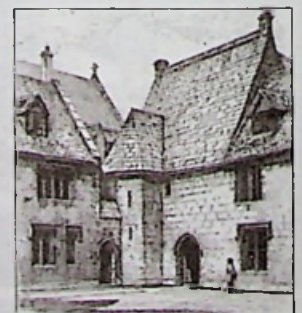
Megtalálható a www.nca.hu honlapon!