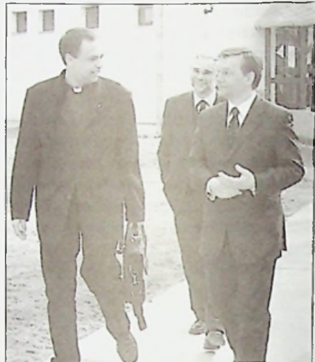
Nyégyszemközi beszélgetés után Axel Werner és Orbán Viktor átsétál az ünnepség színhelyére

A miniszterelnök úr elfogadva meghívásunkat ellátogatott az ünnepi szentmisére és az azt követő ünnepségre, melyen felszólt és az alábbiakat mondta: