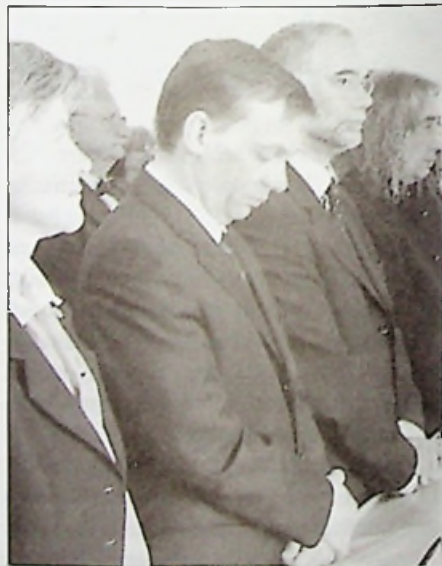
Szemkeő Judit elnöksasszony mellett Orbán Viktor, az ünnepi szentmisén