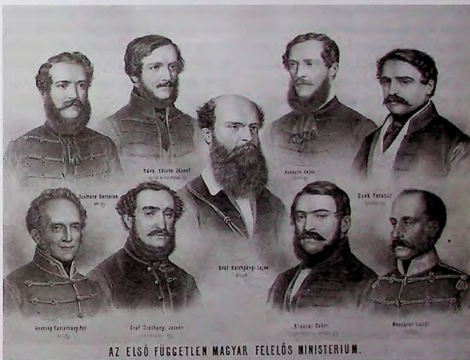
AZ ELSŐ FÜGGETLEN MAGYAR FELELŐS MINISZTERIUM.

Ez meg is történt 1849. október hatodikán, azon a napon, melyen vértanúhalált halt Aradon a szabadságharc tizenhárom tábornoka. Batthyány Lajos is vértanú volt. A becsület és igazságosság vértanúja. Az ellene indított per koncepciós per volt. Halálos ítélete eleve el volt döntve. A felségárulás büntetést próbáltak rábizonyítani, ami törvényes úton lehetetlen volt. Ám közbelépett a női büszkeség és hiúság. Zsófia főhercegnő, Erzsébet királyné rosszindulatú anyósa személyesen szorgalmazta Batthyány kivégeztetését. Nem tudta ugyanis feledni, hogy a jóképű magyar gróf visszautasította kö-