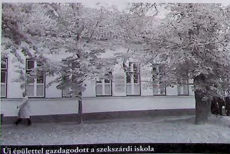
Új épülettel gazdagodott a szekszárdi iskola

felkarolása, piacképes szakmához juttatása, továbbtanulásra előkészítése.