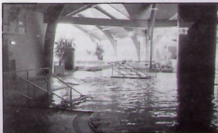
A kibővített és gyógyvízzel ellátott medencék