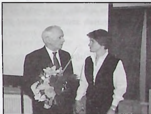
Az elnökváltás pillanata

"Ha jobb jövőt akartok, a nevelésben segítsetek!"