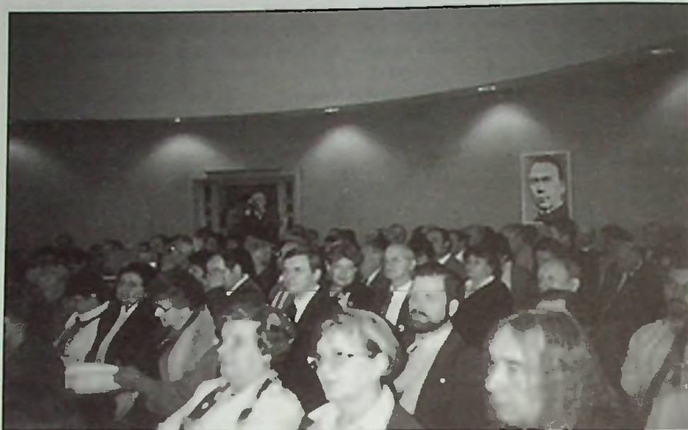
A közgyűlés résztvevői