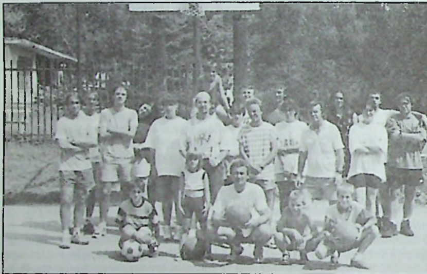
A körmendi találkozó