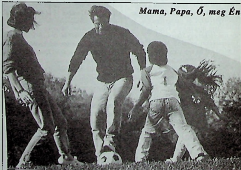
Mama, Papa, Ó, meg Én

(Megjelent a Rheinische Volksblätter 1854. évfolyamában)