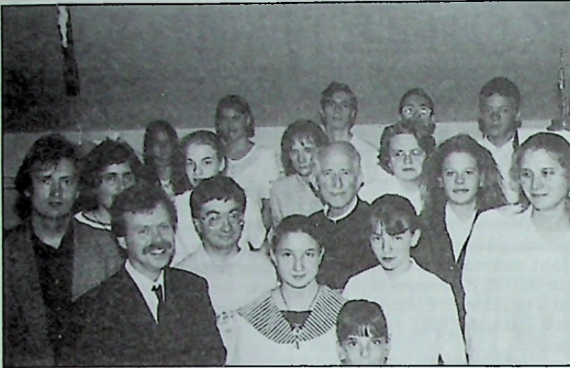
A győri Kolpingosok és prézesük