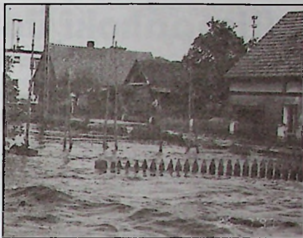
Brzesko, 1997. július 26.