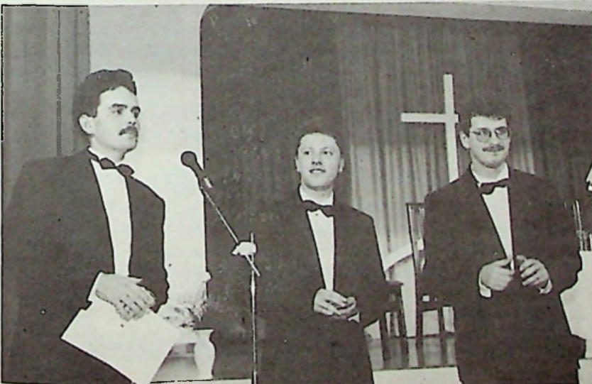
„Sonoro Duo” a kaposvári lemezbemutatón