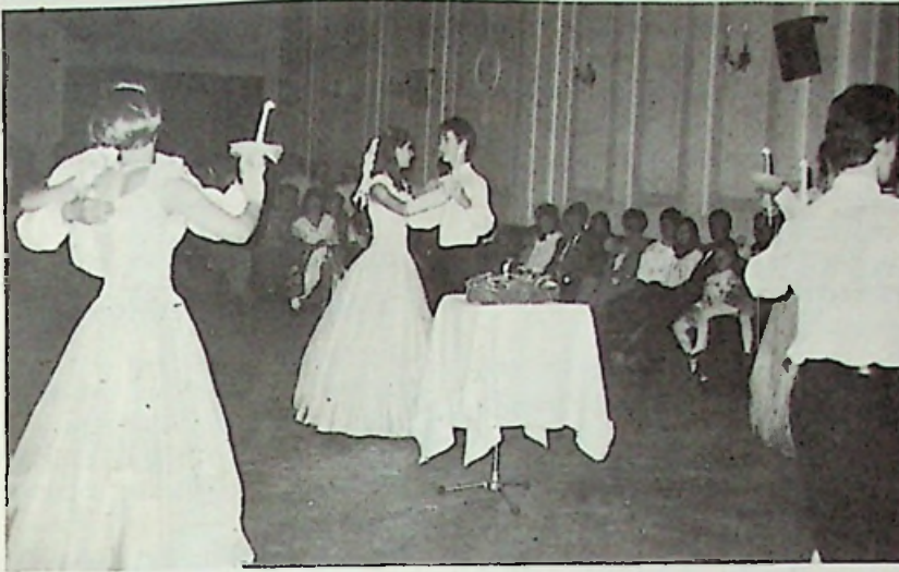
Kolping „Katalin-bál” Eger • Gyertyafényes angolkeringő